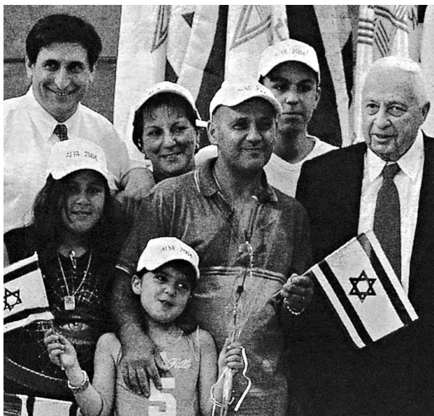
Ariel Sharon empfängt Einwanderer aus Frankreich: Israels Premier hatte Frankreichs Juden zur „Aliah“ aufgerufen

ihre Benachteiligung als selbst verschuldet darzustellen. Die eingangs erwähnte zweite, eher linksalternative Meinungsströmung, die sich mit den antijüdischen Vorfällen sichtlich schwerer tut und deren „Überbetonung“ und „Überfrachtung“ wittert, fühlte sich bestätigt.