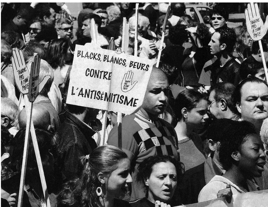
Der „Marsch gegen den Antisemitismus“ in Paris vom Mai 2004, eine gemeinsame Initiative des Jüdischen Studentenverbands, der Bewegung SOS-Rassismus und franko-arabischer Feministinnen

Ebenso übernahm diese Frauengruppe, gemeinsam mit dem jüdischen Studentenverband und der Bewegung SOS-Rassismus, eine führende Rolle bei einem „Marsch gegen den Antisemitismus“ im Mai 2004, als wieder einmal die gegen Juden gerichteten Angriffe spürbar zunahmen. Allerdings befanden sich unter den rund 20.000 Marschteilnehmern dann nur sehr wenige Franko-Araber oder Franko-Afrikaner – ein weiteres Zeichen dafür, dass diese Frauengruppe unter den Jugendlichen aus moslemischen Migrantenfamilien zumindest diesbezüglich kaum auf Gehör stieß. Die übrigen französischen Antirassismus-Organisationen waren zwar